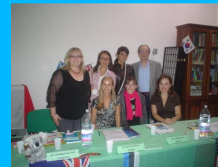
Partecipanti del Programma 2009

Si invita la S.V. a partecipare al Seminario.